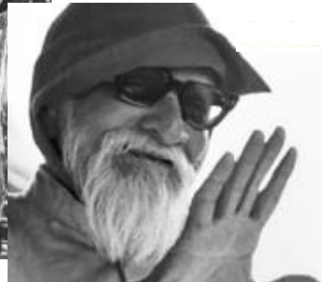
Vinoba Bhave (1895 – 1982)