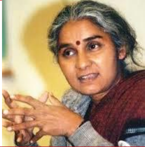
Medha Patkar (*1954)