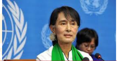
Aung San Suu Kyi (*1945)