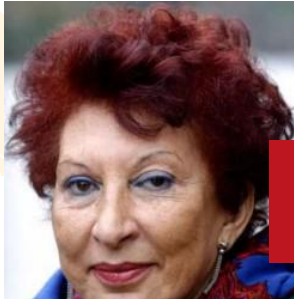
Fatema Mernissi (1940 – 2015)