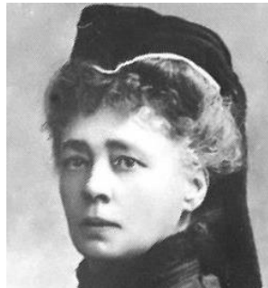
Bertha v. Suttner (1843 – 1914)