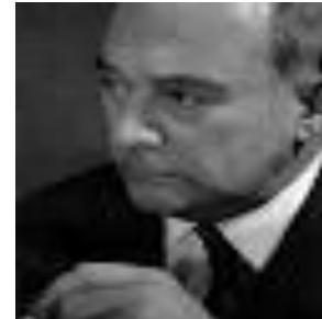
Helmuth Plessner (1892 – 1985)