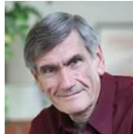
Marshall B. Rosenberg (1934 – 2015)